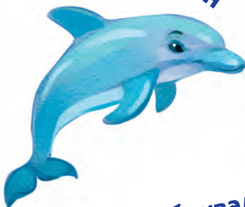
дель Ф ин