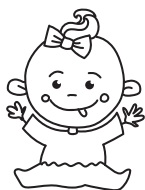
babe [beɪb] малыш