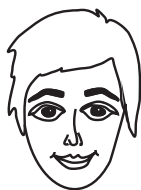
face [feɪs] лицо