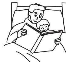
dad [dæd] папа