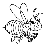
bee [bi:] пчела